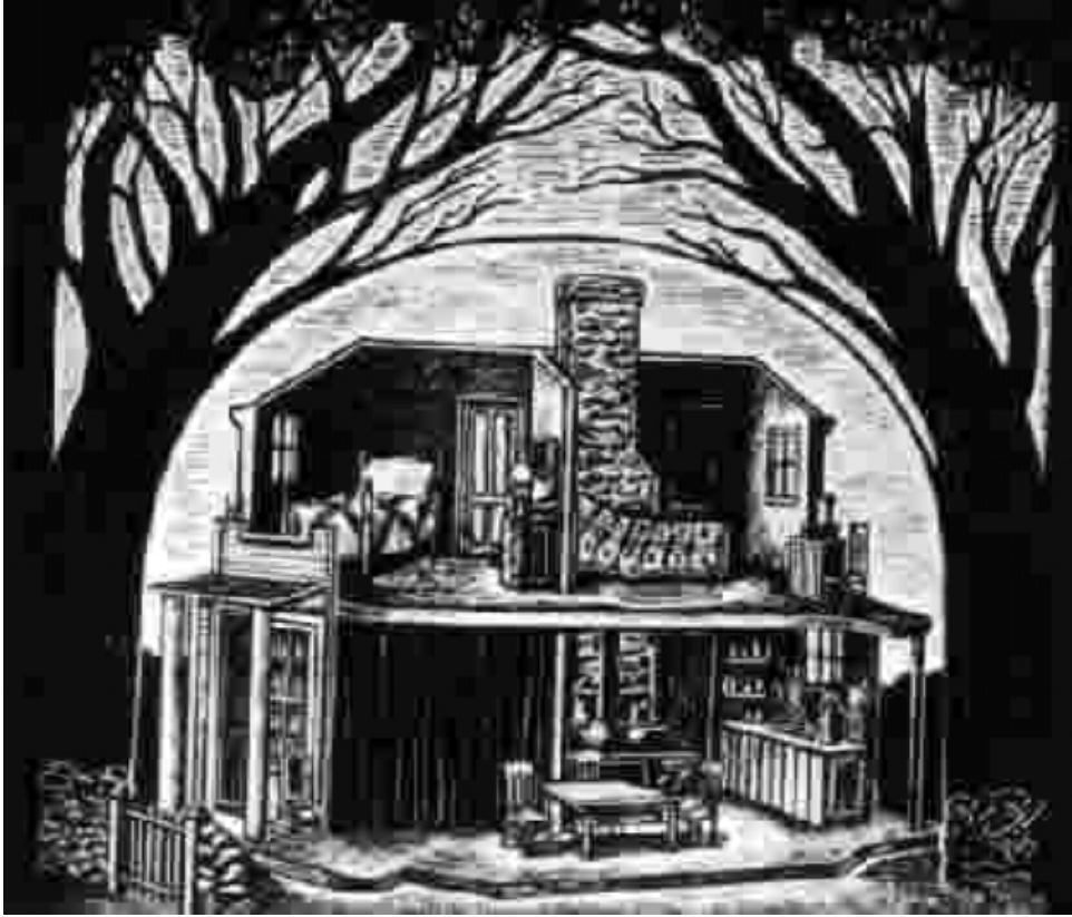
Boceto de decorado para "Deseo bajo los olmos"